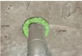
FM710 zur Verwendung bei Hohlräumen in Wänden, an Rohrausbrüchen und tiefen Durchdringungen.