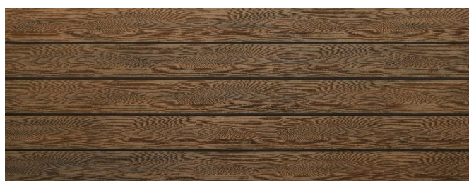
Thermoeiche (Optik) struktur