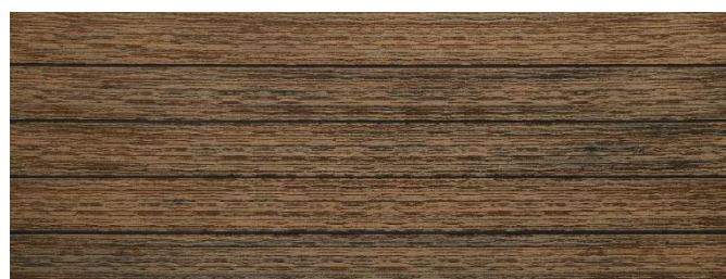
Thermoeiche (Optik) gebürstet