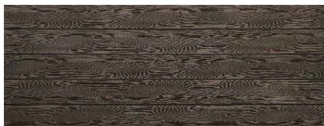
Thermoesche (Optik) struktur