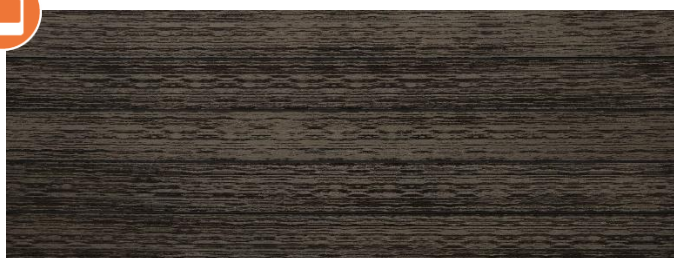
Thermoesche (Optik) gebürstet